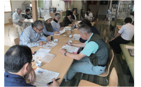
食品衛生に関する勉強会の模様。その他にも認知症サポーター養成講座などの研修会を受講。