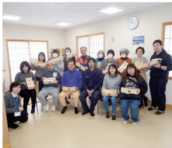
むつ高等技術専門学校と連携してヒパティッシュケーキづくり講座を開催。

地域住民が主体となった運営組織と拠点となる施設ができたことによって、地域を元気にするための活動を幅広く展開できる態勢となっている。