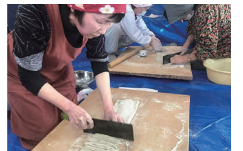
そば打ち講座。地元の特産品を使った商品開発と会員の技術力向上を目的に開催。