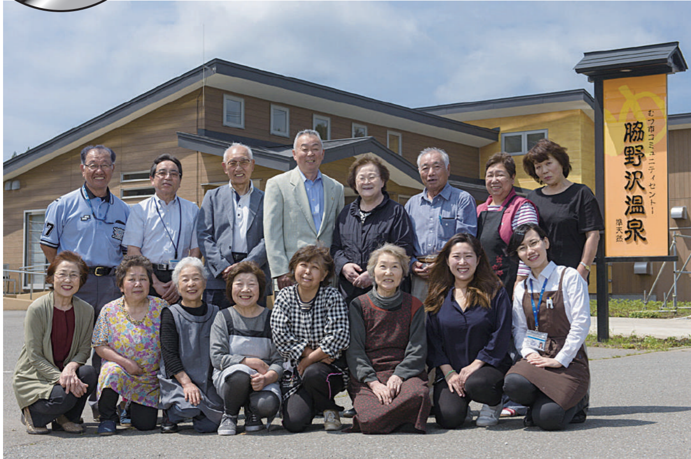
ワークショップを積み重ね、試行錯誤を繰り返し、完成した地域住民待望のコミュニティセンター脇野沢温泉。

コミュニティセンターを核にした小さな拠点による 脇野沢創生プロジェクト～センターだヨ！全員集合～