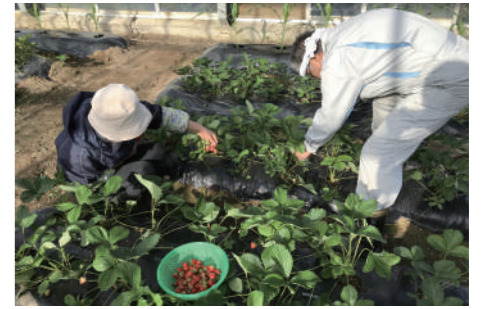
ガラスハウスでの収穫の様。収穫した野菜等は温泉施設内で販売。

温泉湯好会の取組は、地域資源を活かして地域住民が一体となって拠点を作り上げていくことで、住民の地域への愛着を醸成し、温かな憩いの場を再生している点が高く評価できる。