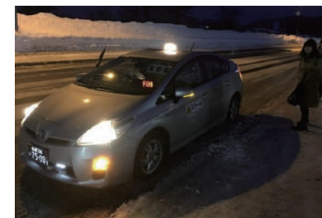
スクールバス平日部活便の運行。この日は予約人数が2人のため、小型のタクシー車両で無駄なく運行することができた。

朝のデマンド利用もスクールバスに便乗するなど、厳しい財政にもかかわらず交通輸送体系の改善は進んでおり、高校生とのユニークなコラボによる成果は高く評価できる。