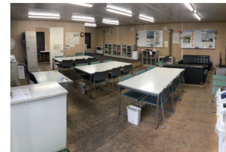
バスまちスポット内部の様子。高校生が、「公共性」を念頭に置きながら検討した施設機能や備品及びその配置案を、ほぼそのまま反映した。