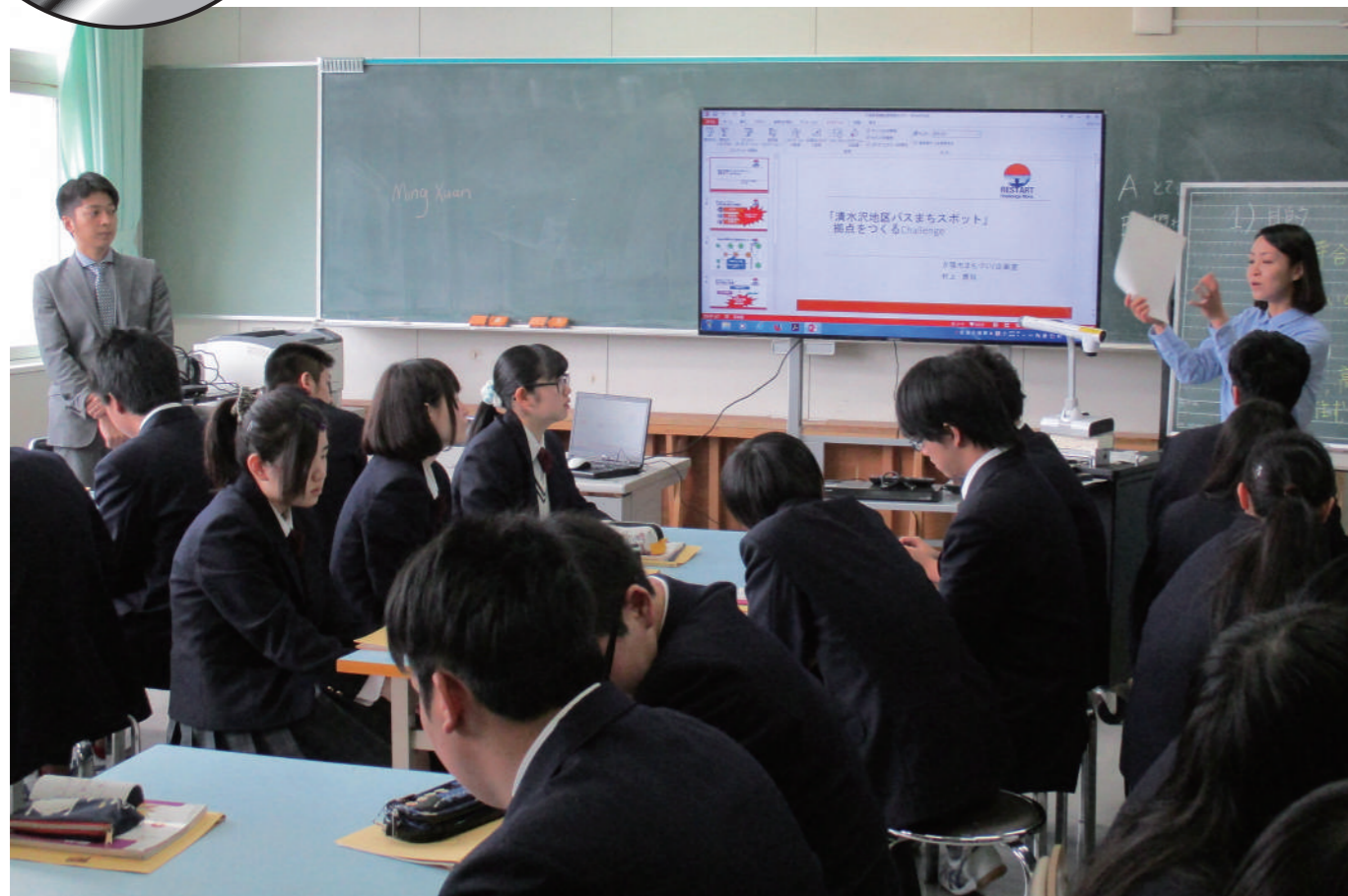
家庭科の授業風景。計7時間の授業を経て、施設の機能や空間デザイン案を策定。