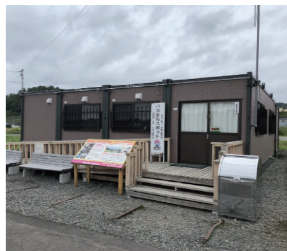
「バスまちスポット」。本施設の企画に当たっては、北海道夕張高等学校と協働し、空間デザイン等について同校生徒の参画を受けた。

現在、システムは順調に稼働し、生徒が予約システムを活用することによって地域交通を守る取組が続いており、平成30年度には、年間約130万円の運行コスト節減を達成するなど着実に成果を上げている。